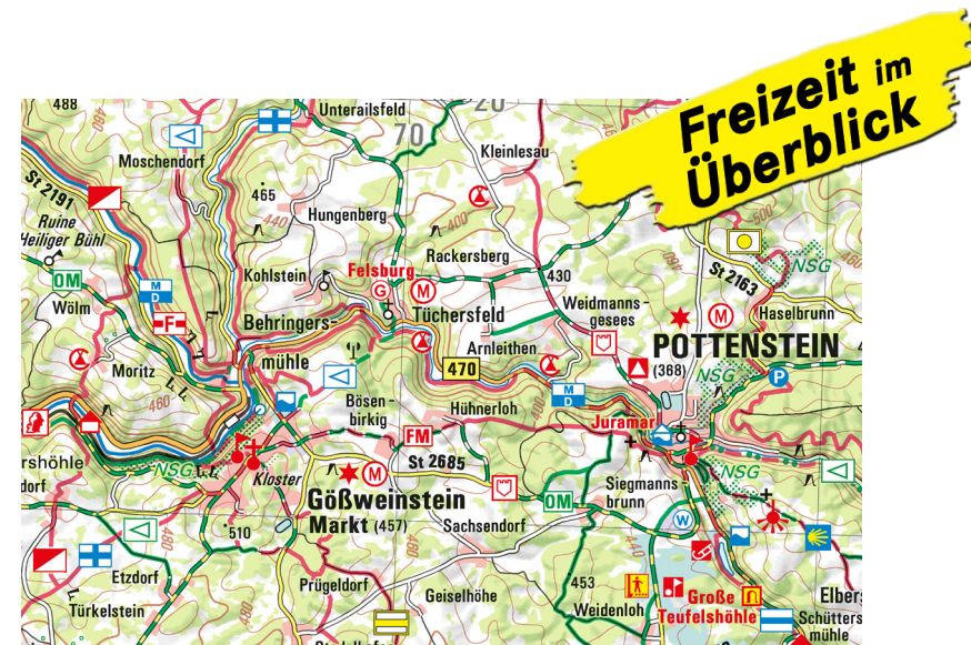
Ausschnitt aus ATK100-6 Nürnberg Ost

Touristisch äußerst attraktiv ist die Fränkische Schweiz mit dem Wiesental und den bekannten Orten Pottenstein und Gößweinstein. Die sehenswerten Burgen, berühmten Schauhöhlen und die malerischen Felsformationen können über die markierten Freizeitwege wie zum Beispiel den Fränkische Schweiz Radweg entdeckt werden. Tolle Freizeitangebote wie Freibäder, Freizeitparks und Freilichtmuseen runden das Angebot dieser bekannten Urlaubsregion ab.